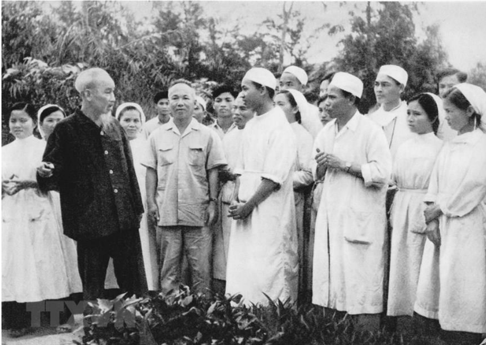
Thăm Bệnh xá Vân Đình (Hà Tây cũ) ngày 20/4/1963, Chủ tịch Hồ Chí Minh căn dặn cán bộ bệnh xá thực hiện "Lương y như từ mẫu".