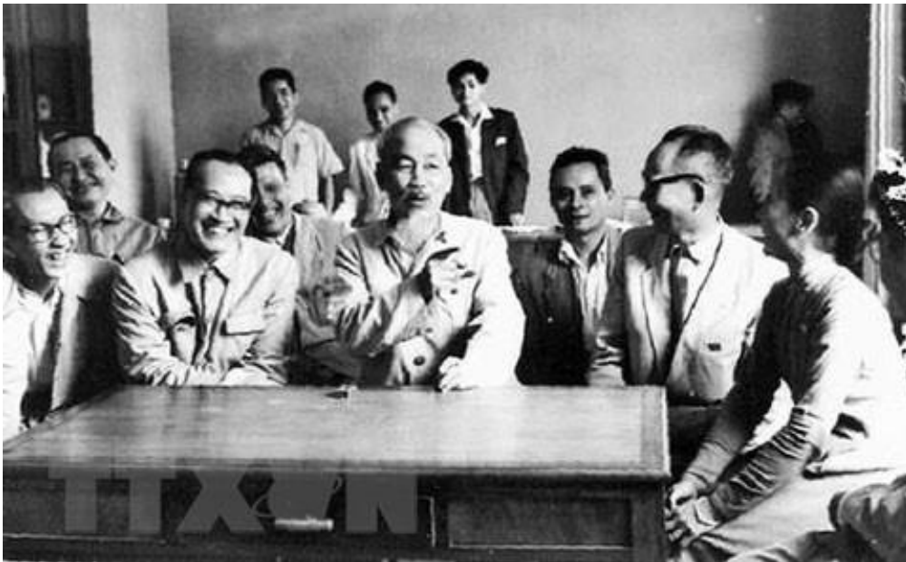
Bác Hồ nói chuyện thân mật với giáo sư, bác sĩ Trần Hữu Tước (bên trái) - người sáng lập và xây dựng ngành Tai - Mũi - Họng Việt Nam và các trí thức ngành Y (tháng 3/1964).