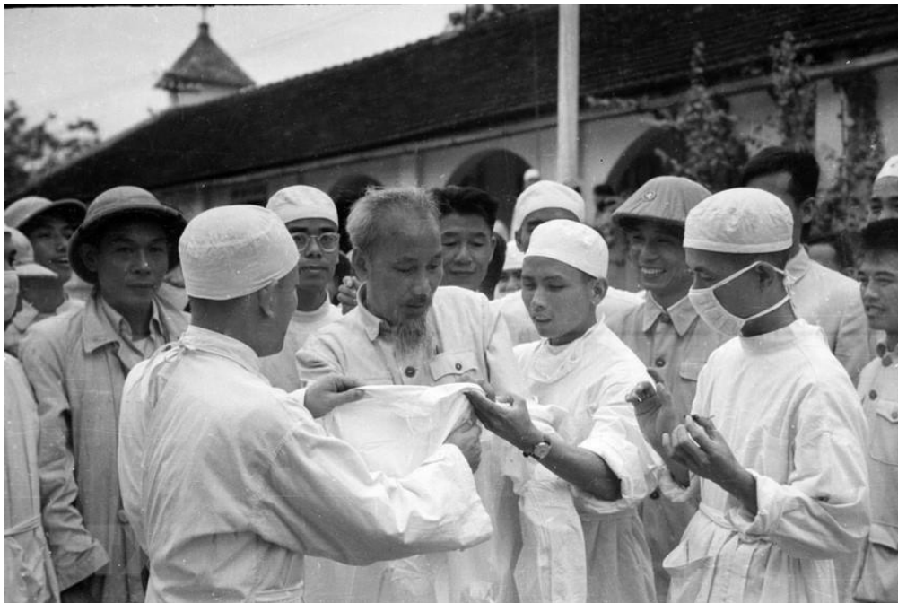
Chủ tịch Hồ Chí Minh thăm Viện Mắt Trung ương.