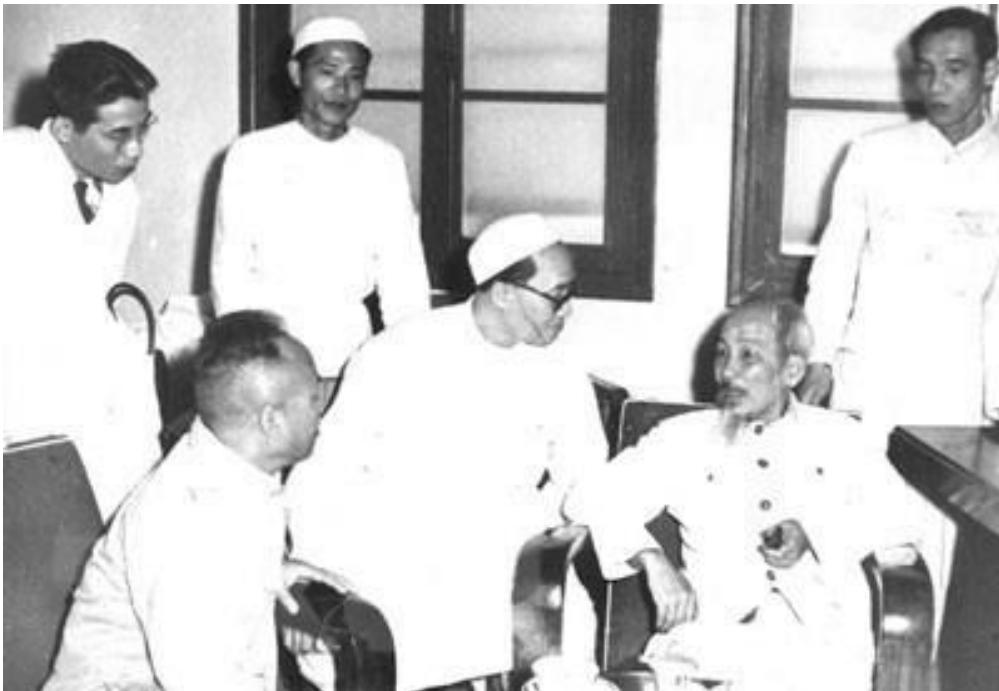
Chủ tịch Hồ Chí Minh với Bộ trưởng Bộ Y tế Phạm Ngọc Thạch, Giáo sư, bác sĩ Trần Hữu Tước.