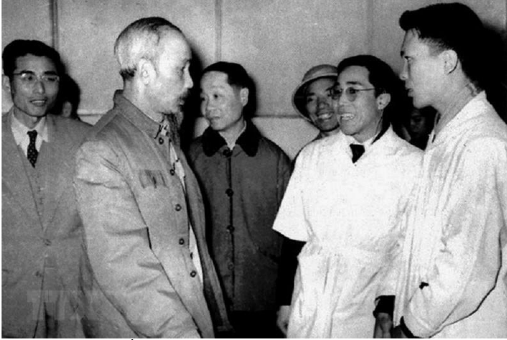
Bác Hồ với các bác sĩ ngành Quân y (năm 1954).