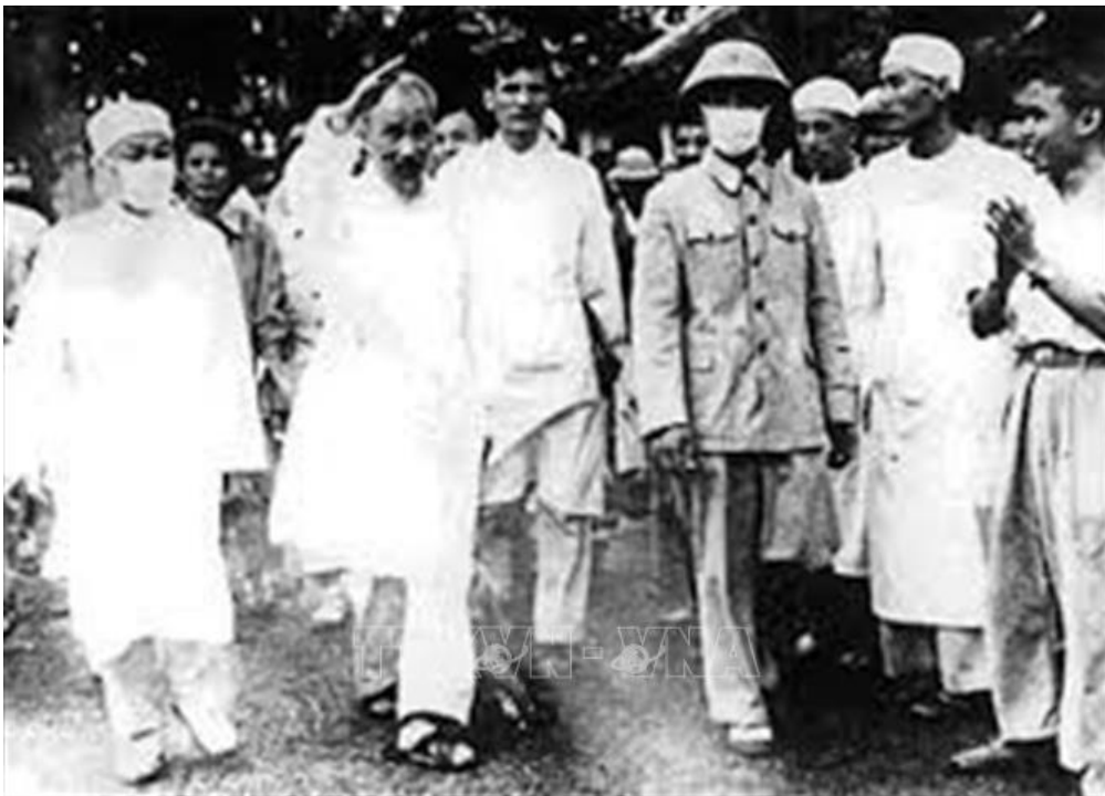
Bác Hồ thăm Bệnh viện Quân y 7 (5/1967).