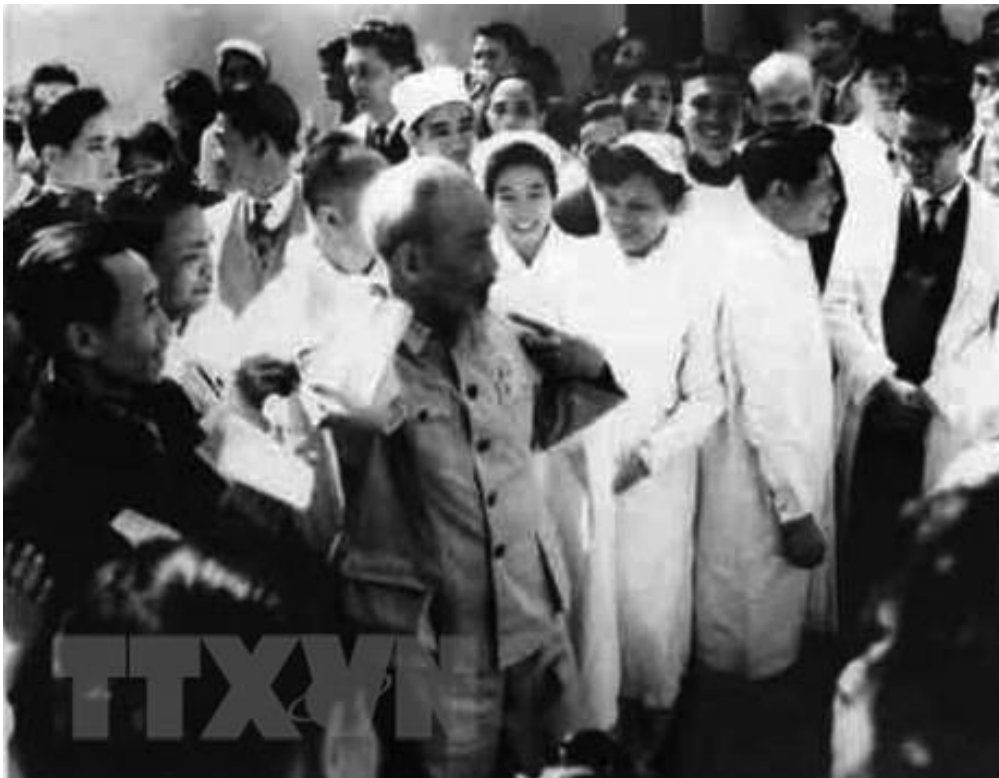
Bác Hồ nói chuyện với cán bộ ngành Y tế.