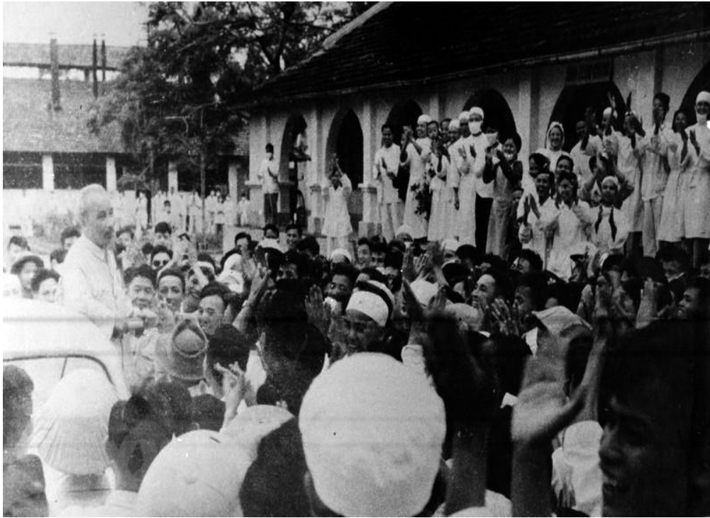
Chủ tịch Hồ Chí Minh thăm Viện Quân y Hải Phòng (tháng 5/1957).