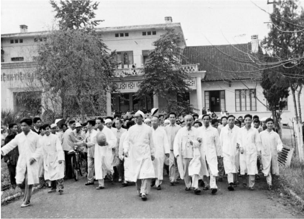
Chủ tịch Hồ Chí Minh thăm Bệnh viện Bạch Mai (Hà Nội).