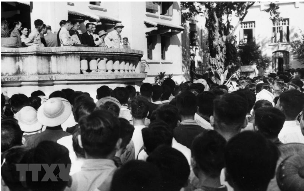
Chủ tịch Hồ Chí Minh nói chuyện với giảng viên, sinh viên Trường Đại học Y Dược Hà Nội (ngày 14/01/1955).