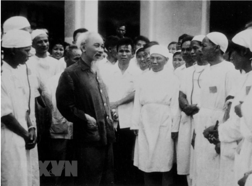
Chủ tịch Hồ Chí Minh thăm Bệnh viện thành phố Nam Định (ngày 22/5/1963).